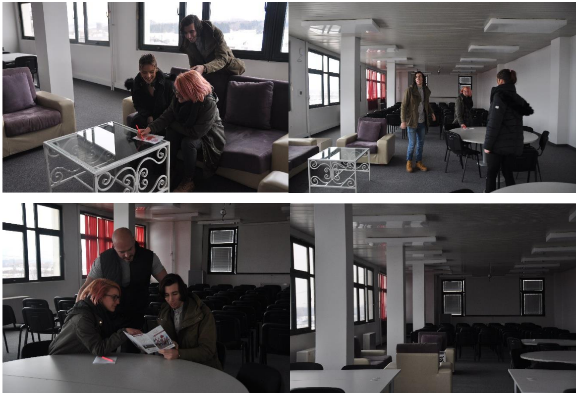
Slika 4: Fotografije Kreativnog centra

Fotografije prostora Kreativnog centra Univerziteta Metropolitan Beograd – Centar u Nišu (slike 3 i 4).