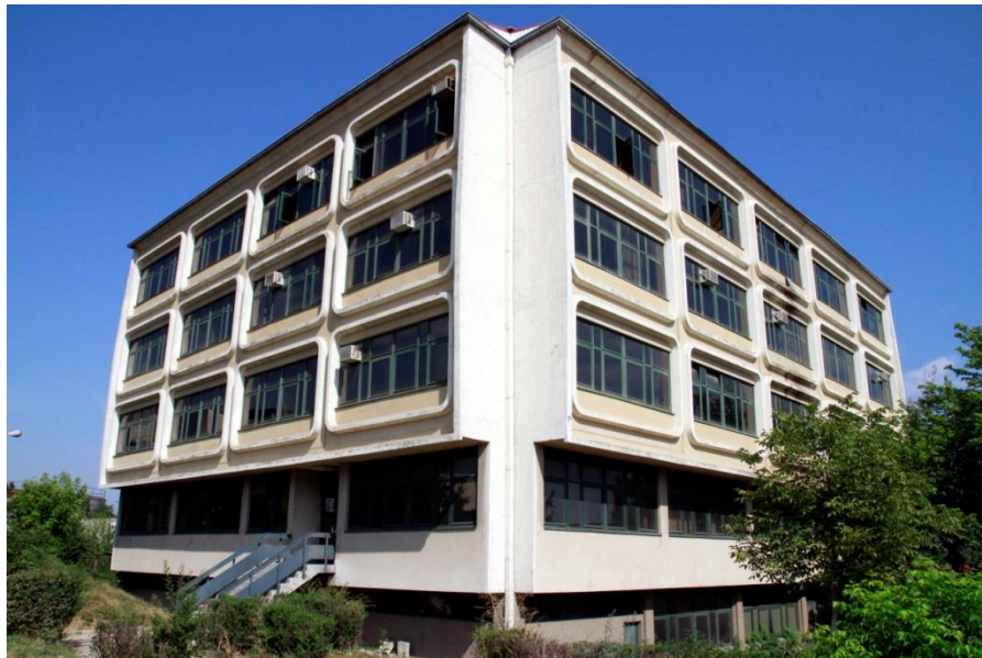
Slika 2: Zgrada Poslovno-obrazovnog centra Univerziteta Metropolitan u Nišu

Prostor je klimatizovan sa izvedenom instalacijom i u potpunosti je funkcionalan i odgovora kreativnim i stvaralačkim zahtevima njegovih korisnika, a ujedno omogućuje i organizaciju različitih programa za razvoj kreativnosti i preduzetništva (slike 3 i 4). U Centru će timovi imati priliku da rade na razvoju ideja, drže prezentacije, sastanke, radionice, događaje i slično.